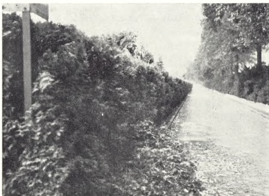
Fig. 88. Tax hække, hvor en stærk nedfrysning og efterfølgende tilbage- skæring ikke kan ses.