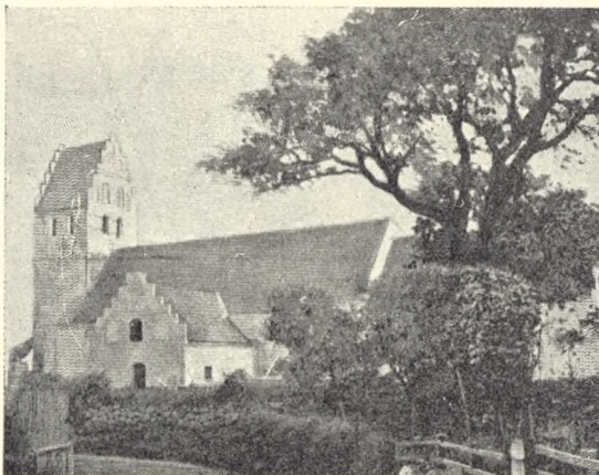
Fig. 4. Fynsk landsbykirke- gård med asketræ (Harreslev).

Mon ikke den stemning, man da kommer i, er den bedste baggrund for et „provstesyn“? Man bliver ret ømfindtlig overfor stødende indtryk, enten de nu kommer fra uorden, ukrudt eller grimme gravmæler. Derimod vil det næppe støde,