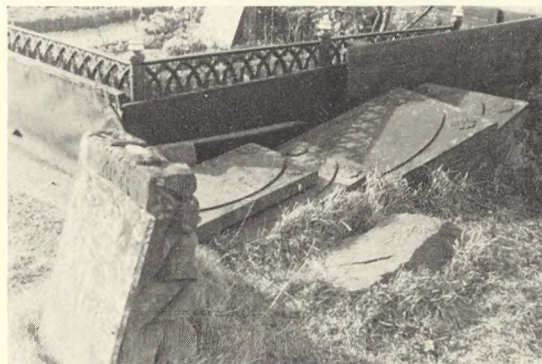
Fig. 6. Uheldig placering af kasserede gravmæler.

Den geografiske adskillelse af kirke og kirkegård resulterede ganske logisk i, at der på kirkegårdene måtte bygges kapel-