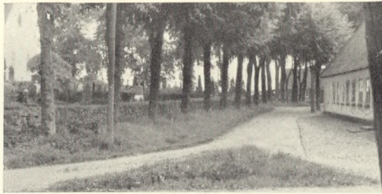
Fig. 5. Typisk sønderjysk træramme om kirkegården (Ullerup).

Og lovens udførelse resulterede i 2 meget væsentlige ting, nemlig at kirke og kirkegård blev adskilt fra hinanden og behandledes som 2 forskellige ting, samt at