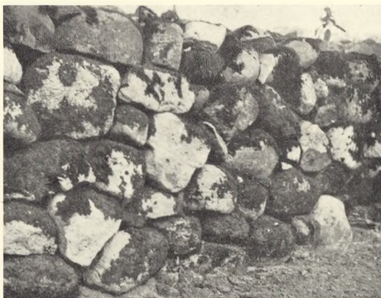
Fra venstre: Fig 1.

Fra Rinkenæs kirkegård. Centralt græsparti med syrenhegn.