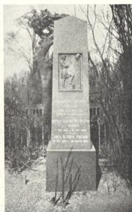
Fig. 89. H. E. Freund : Gravmæle for H. V. Bissen og G. C. Freund (død 1840).