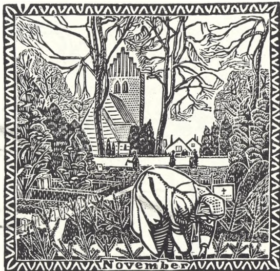
Fig. 74. November. Træsnit af Alfred Jensen.

I den fine pyntning får gartneren lov til at lade sin fantasi spille og vise sin dygtighed på kunstens område, og det er mange gange rene kunstværker at se på. Foruden gran og fyr anvendes til nedstikning ilex, buxbom, tax og cypres og ofte også gulbrogede former af disse. Granen lægges særlig pænt, og på de større grave dækkes et parti og på de mindre grave, f. eks. urnegrave, det hele med små, fingerstore stykker af rødgran, blågran eller tax, der dels lægges som hvælvede puder, dels så blågranen danner smukke motiver eller tegninger på en baggrund af et mørkegrønt taxtæppe, f. eks. et malteserkors, fransk lilje, en juleklokke, et anker — ofte på sømænds grave — eller andet efter kundens ønske eller efter