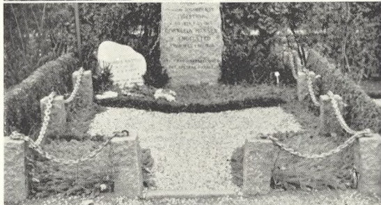
Fig. 76. Almindelig pyntning, Solbjerg kirkegård, Frederiksberg. 1953.