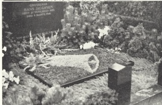
Fig. 78. Fin pyntning med klokkemotiv, Solbjerg kirkegård. Foto: A. Hilsøe 1953.