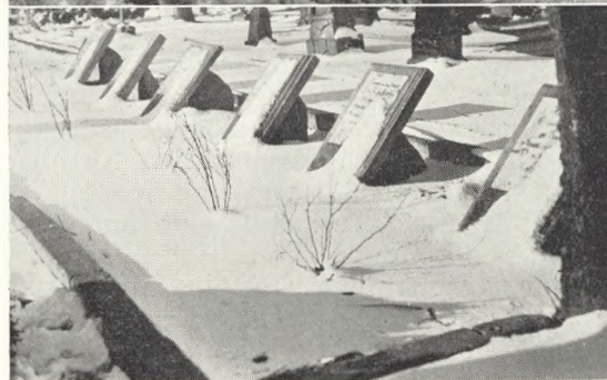
Fig. 79. Her er ikke brug for nogen pyntning. Egvad 1940.