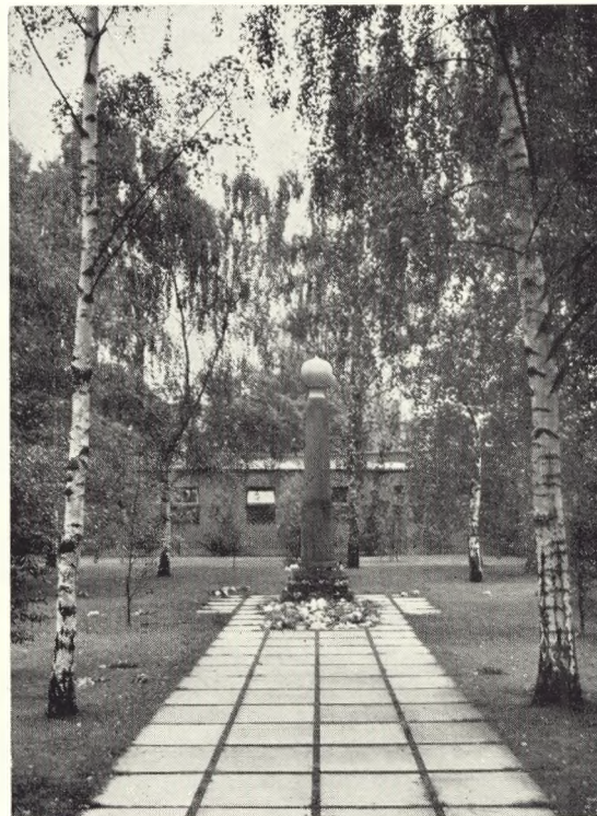
Fig. 106. Nuværende fællesgrav på Bispebjerg kirkegård med mindesøjle af arkitekt, m. a. a. Holger Jacobsen.

i sin anlægsform bryder fuldstændigt med den traditionelle kirkegårdsudformning med dens mangfoldighed af indhegnede gravsteder, monumenter og gange. Nedsættelsen af askerne sker i fællesgravèn, uden at de pårørende får at vide, hvor den har fundet sted, og der kan som følge