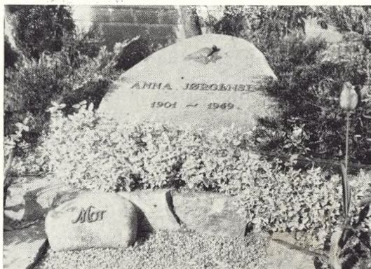
Fig. 102. Det synes somom det er umuligt at undgå eenstavelsergravmælet, skønt der allerede findes et mere oplysende mindesmærke på gravstedet. Skive.