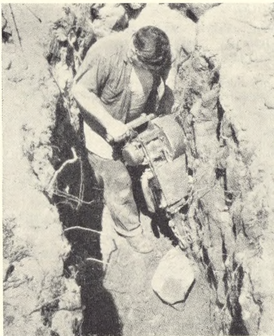
Fig. 204. Der arbejdes med trykluftredskaber.