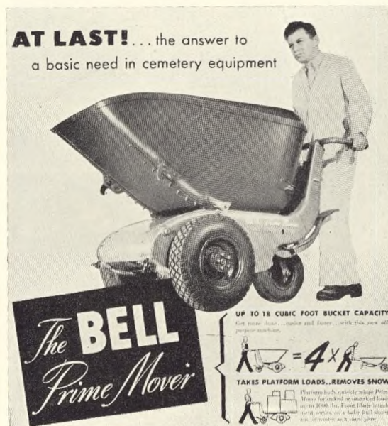
Fig. 207. Motoriseret form for trillebor.

»Skulle der heri være noget som helst utiltalende eller u-etisk?« spørges der, og