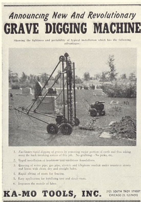
Fig. 205. Maskine til gravkastning.