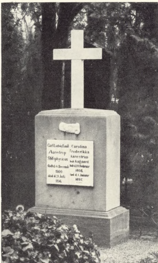
Fig. 2. Aarestrups mindesten fra 1830'erne. Odense Assistens kirkegård.

Vi har altså søgt at avbøde visse vanskeligheder, — vi har også søgt at få noget mere praktisk og noget smukkere frem. Det er redaktionens håb, at vore læsere synes, at vi har haft held med os. Og dermed ønsker vi, at denne indgang til V. K.s bind 17 må love en frugtbar fremtid. —