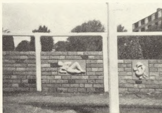
Fig. 113. Mindemur for om- komne i tyske kon- centrationslejre, Almenkirkegården, Ålborg (under opførelse; Bøgh og Hoffmann).