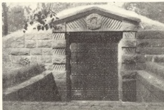
Fig. 112. Privat mausoleum, Almenkirkegården, Ålborg.