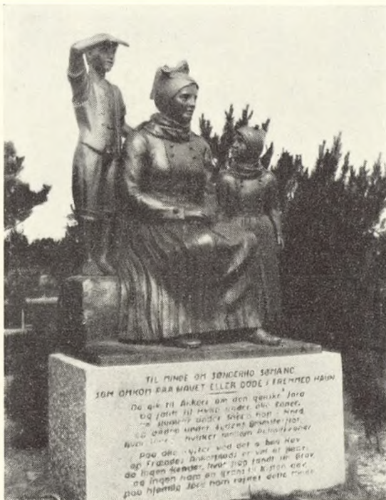
Fig. 107. Mindesmerke for omkomne søfolk (billedhugger Elo \dagger ) Sønderho. Jevnf. fig. 109 og 111.

som viste seg å ha en serdeles pent vedlikeholdt kirkegård (fig. 101 og 106). Nydelig var gravkvartalene langs hovedveien, og stilig var kapellet. Av trær, så det ut til at Thujaen hadde inntatt hedersplassen. Kirkegården letes av Emm. Jensen .