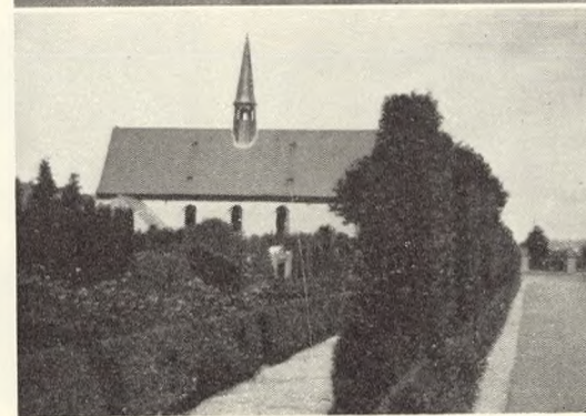
Fig. 102 (nederst tv.). Parli fra den nyere del af Viborg kirkegård.