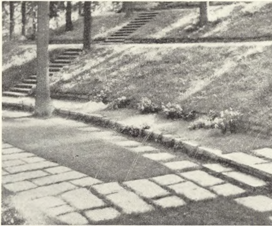
Fig. 98–100. De nye flisegange og trapper m. m. på Karlskoga skogskyrkogård. Se teksten foregående side.