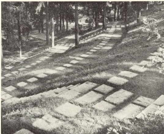
Tilhøire: Fig. 101. Parti fra Herning kirkegård.