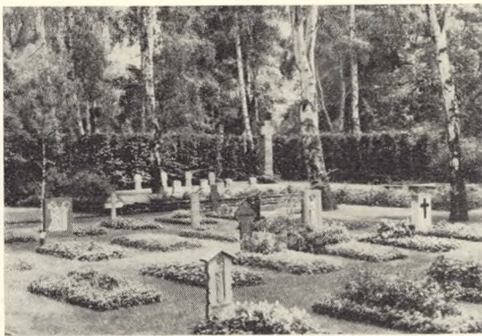
Fig. 213-14. Kirkegårdspartier fra udstillingen i Hannover 1951.

Det siger sig selv, at al god jord i Holland skal udnyttes på det yderste til land- og havebrug, og kirkegårdene anlægges