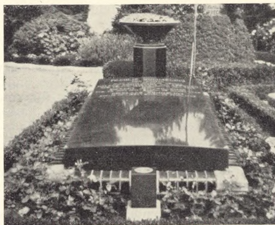
Fig. 215. Liggesten på grav i Holland.