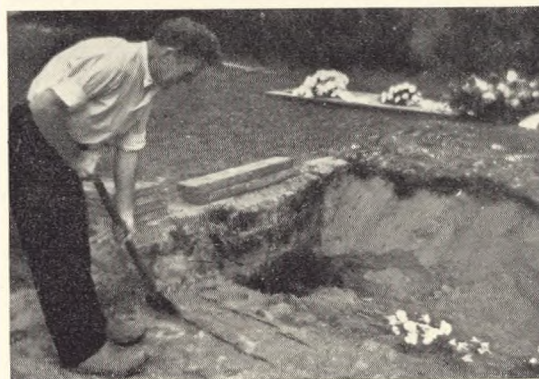
Fig. 216. Der kastes jord på det fjerde lag af kister samtidigt med, at en ny grav graves.