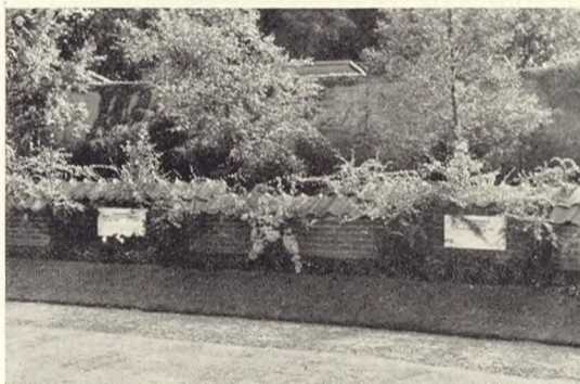
Fig. 221-22. Partier fra urnelunden i Svendborg.