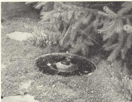
Fig. 45. Fuglebad, Hauptfriedhof, Stettin.

og atter andre vil boltre sig i det fugtige element; ringene giver de forskjellige fuglearter og fugletemperamenter netop de muligheder, som de enkelte fuglearter kan ønske sig, og så giver de een ting til: de giver mulighed for at fugleunger, som ikke er erfarne i at kunne flyve op, når de forskrækkes af vandbadet, kan kravle op ad siderne og bjerger sig ind på det tørre, mens de let vil drukne, f. ex. i vandkummer, der ikke tager hensyn til denne side af sagen. Denne fuglebadtype er både sød og fin at se på, og rigtig i sin konstruktion og holdbar (brændt ler), god til haver såvel som kirkegårde. Og om betydningen af sangfuglelivet på vore kirkegårde er der vel ingen tvivl. Herom kan jo også læses i V K. XV pag. 26—28 og 50—52.