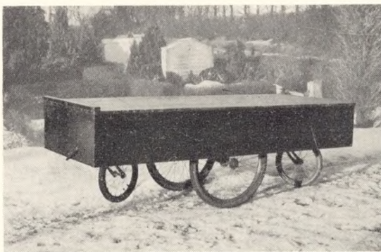
Fig. 201. Katafalkvogn i Esbjerg.

Der har været stor interesse for den snilde og enkle samt praktisk konstruerede katafalkvogn.