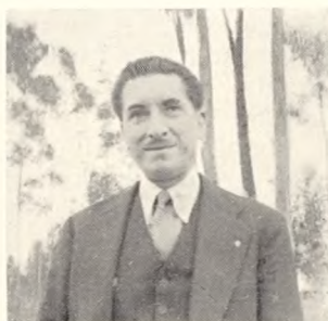
Fig. 189. Lederen af San Diego kirkegård: A. Endarra C.

Landsbykirkegårdene (fig. 188) er meget primitive, domineres i reglen af et stort kors, men alt gør et forsømt og forstemt indtryk.