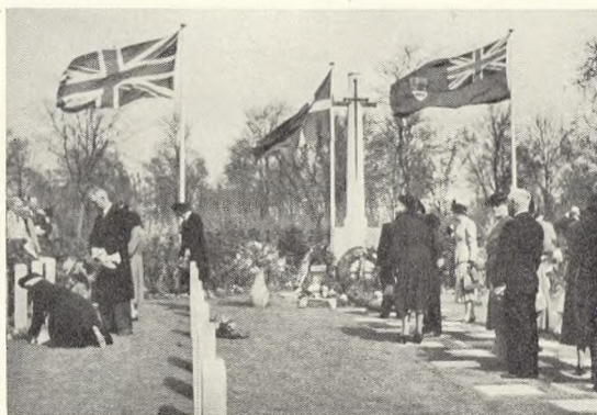
Fig. 46. Den britiske Soldatergrav, Bispebjerg, indviet 5. maj 1950 ved besøg af efterladte slægtninge.