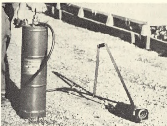
Fig. 48. Flammekasteren »Standard«.

Mens således de britiske soldaterbegrav-velser på Svinø i Sydsjælland og på Bispebjerg nu er færdige, er flere andre tilsvarende begravelsespladser på andre kirkegårde endnu ikke monteret med de normerede Head Stones og særlige sym-boler, men det ventes, at dette vil ske i løbet af 1950.