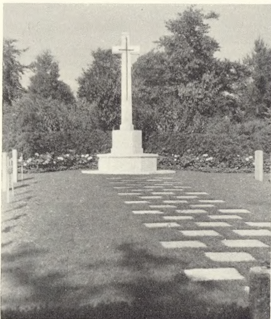
Fig. 47. Den britiske Soldatergrav, Bispebjerg kirkegård, København.

På Bispebjerg kirkegård findes der (foruden de danske soldatergrave fra 29/8 1943 og gravene med de frihedskæmpere, der satte livet til omkring 5/5 1945 samt de politifolk, der blev taget af tyskerne den 19/9 1944, og som døde i koncentrationslejrene i Tyskland, jvnf. VK. XVI pag. 123—26) i samme afdeling og række nogle grave med allierede flyvere , som blev skudt ned over Sjælland.