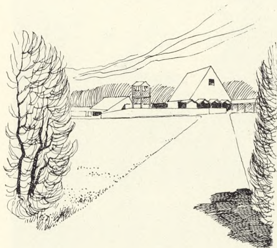
Fig. 208. Kapellet rejser sig på den højeste del af terrainet.

Saaledes som Kirkegaarden er formet i Hovedlinjerne, forekommer det naturligt, at Inddelingen af de enkelte Gravgaarde løses efterhaanden som de tages i Brug, idet der utvivlsomt vil være Mulighed for større Afveksling, naar Detaljeløsningerne fremkommer i organisk Sammenhæng med Kirkegaardens voksende Bepantning.