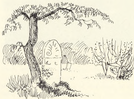
Fig. 209. For urnebegravelser 5x5 m i fri udformning kan enten anlægges det negative synspunkt, at stenene skal syne mindst muligt, altså f. eks. dybt ned-gravede kampesten — eller det positive, at monumenter af høj kunstnerisk kvalitet indgår i et sammenspil med træer, græs, lys og skygge. Jevnfor Jægerspris slotshave.