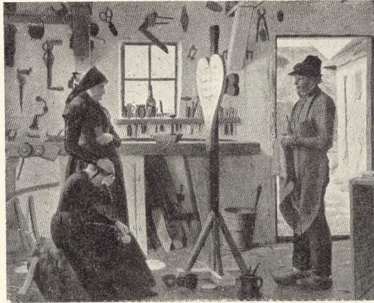
Fig. 234. »To kvinder avlægger besøg hos landsbykunstneren for i hans værksted at se det hos ham bestilte gravkors«. (Chr. Dalsgaard pinx.)

Saadan kunde man blive ved. — Disse Sten kan ikke skabes af Arkitekter — de kan kun skabes saaledes — som de i Tusinder af Aar blev skabt — af Aand og Haand i een Person — Stenhuggeren maa blive — hvad han engang var — Kunstner.