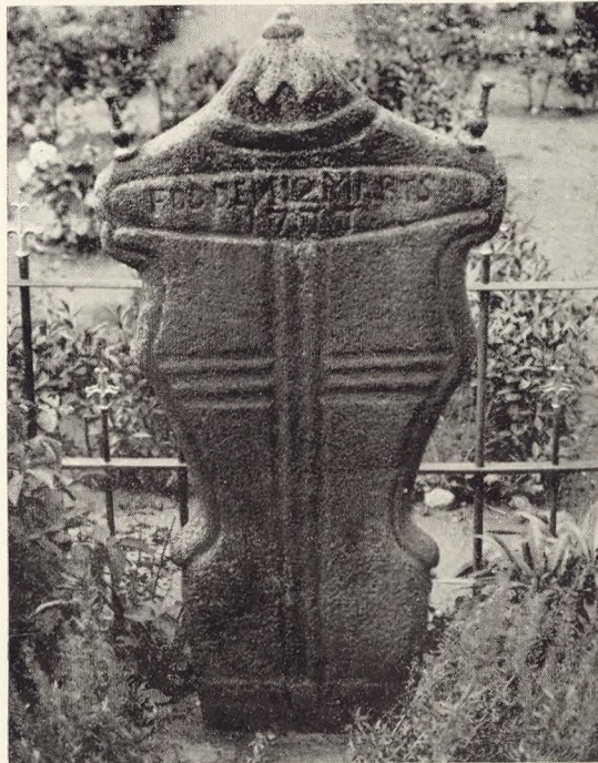
Fig. 235. Hjemmegjort gravmæle i sten fra 1860-erne. Vig kirkegård, Sjælland. (jævnf. V. K. IX s. 47—48).