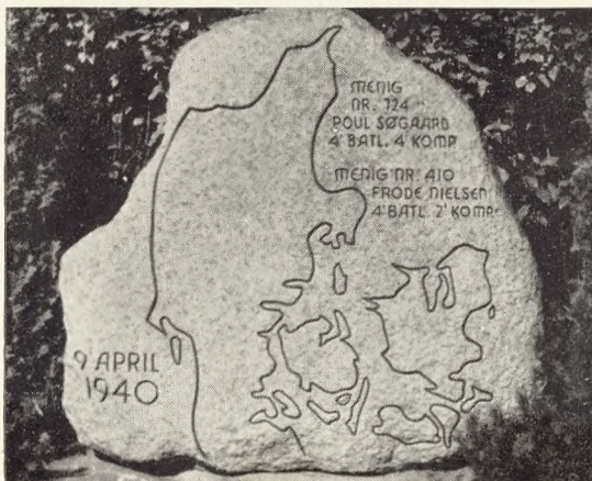
Fig. 236. De faldt for Danmark — derfor viser gravmæle danmarks-kortet. Odense Assistenskirkegård. (Axel Jacobsen). Foto: J. Th. 1946.