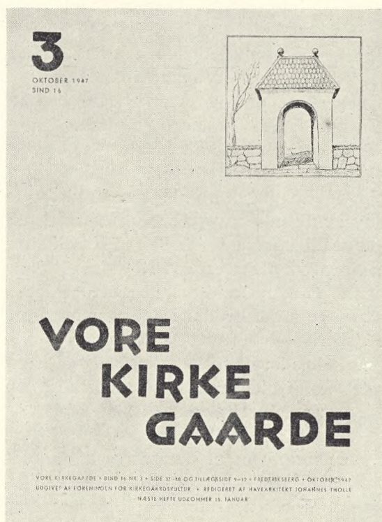
Fig. 86. Omslagets Forside til Oktoberheftet 1947.

ikke kunde opføres ovenpaa Ligkisterne, og det derhos, efter Bygningens Bestemmelse, maatte ansees aldeles urigtigt, at denne