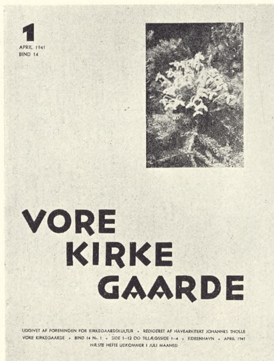
Fig. 85. Omslagets Forside siden 1941.