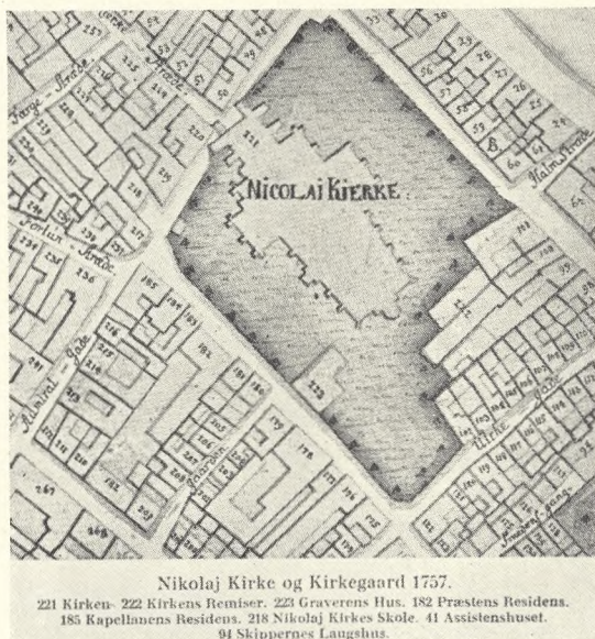
Fig. 87. Nikolaj Kirkegård 1757 (efter Geddes Kort).

blev anbragt paa en uopgravet Deel af en fordums Begravelsesplads. Det blev heraf en Følge, at Pladsen maatte udgraves til en større Dybde, end det ellers for Fundamenternes Skyld vilde have været nødvendigt, da der i Almindelighed fandtes 5 Lag Kister staaende ovenpaa hinanden.