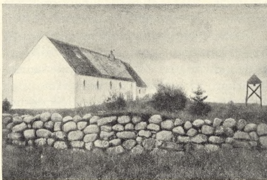
Fig. 178. Råbjerg kirkegård i Nordjylland. Efter et gammelt billede. Jvønf. texten s. 90-91.