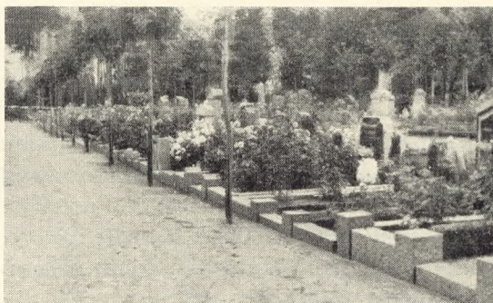
Fig. 177. Gravrække, hvor alle gravstederne er forsynet med karme og polyantharoser (Rønne) (jvønf. fig. 176).

Det er sådanne eksempler på frivillig indordnen sig under hinanden og under en helhed, der afgiver et godt basis for, at man også vedtægtsmæssigt kan opnå noget godt og rigtigt ved at stille krav om dette eller hint i en enkel gravgård, — vel at mærke sådan, at gravgårdene ikke alle blir ens, men hver kan få sit eget karakteristiske præg, — til det fælles gavn, for helhedens skyld og for at kirkegården ikke skal blive roderi, men alvor, harmoni og skønhed.