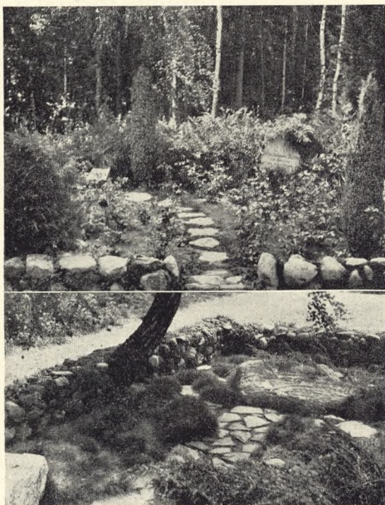
Fig. 174—175. Tillempe og milieu- bestemt gravsted på Tibirke kirkegård.