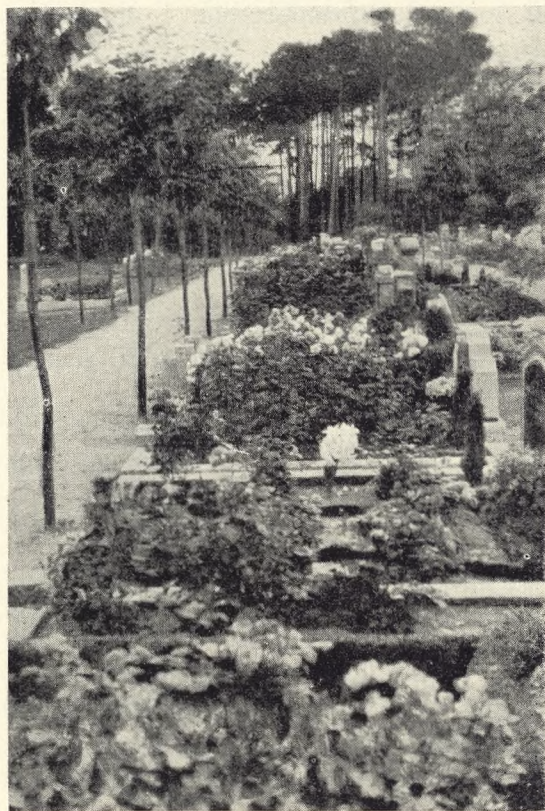
Fig. 176. Gravrække med praktisk talt alle grave forsynet med polyanthoser (Ronne) (jævnf. fig. 177).