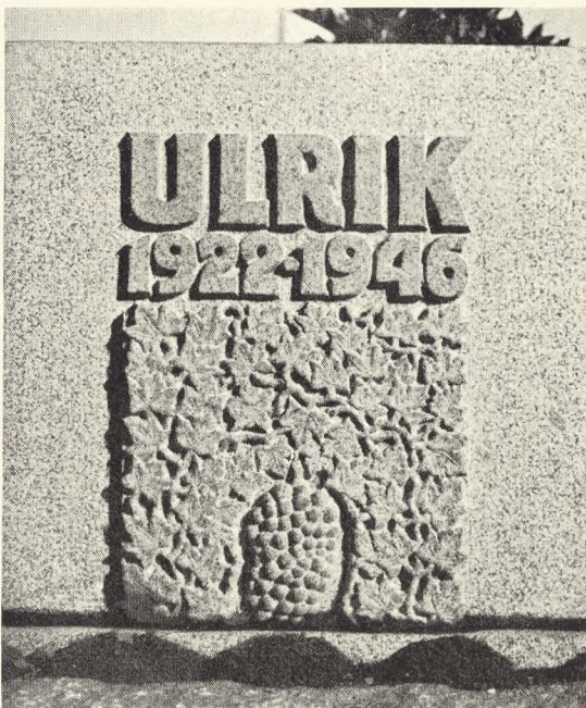
Fig. 240. Til den kun 24-årige søn skønnes fornavnet vigtigst; bladornamenter og vinkloser taler dog om et rigt liv. Nørre Omme kirkegård. (Torvald Westergaard).