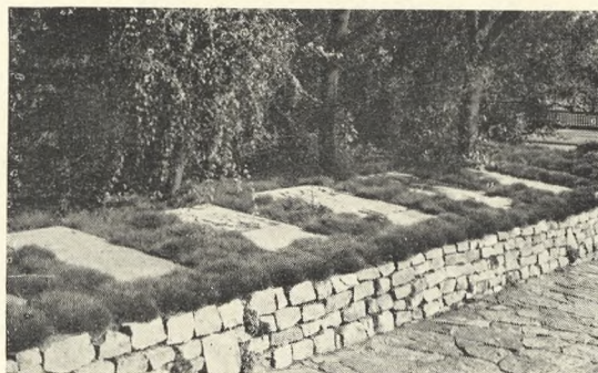
Fig. 67. Gamle Gravsten på St. Olufs Kirkegård i Århus.

Jens Clausen, Johan Richter: Århus gennem Tiderne.