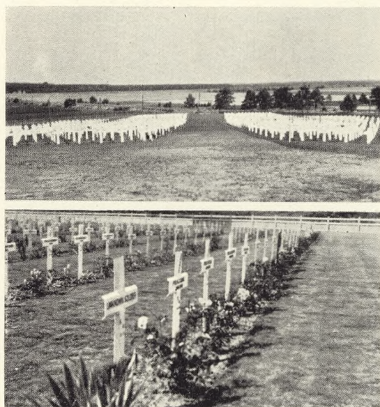
Fig. 257-58. Britisk soldaterkirkegård, Soltau, Tyskland. Foto: A. N. 1949.

Kirkegården, der rummer c. 2500 grave, ligger tæt ind ved landevejen, og den er foreløbig forsynet med de af den britiske krigsgravskommission forordnede hvide metalkors, der naturligvis sidenhen vil blive ombyttet med de for soldatergravene fastsatte Head Stones , som tidligere har været omtalt og beskrevet i V. K. (se XV s. 106—10). Imellem de ordinære kors ses også adskillige zionsstjerner for de faldne medlemmer af de mosaiske trosamfund. Korsene er efter den gængse tradition opsat i meterbrede blomsterrabatter, hvori der er plantet roser og stauder, og spredt over arealet er der nedrammet træpæle, hvorved der er plantet forskellige slyngplanter. Oppe på bakken er der planeret en plads, som er belagt med grus, og det må forudses, at man her vil rejse det obligatoriske Cross of Sacrifice, og rimeligvis vil også The Stone of Remembrance finde sin plads på området; men endnu er dette ikke sket. Arbejdet med kirkegården er under krigsgravskommissionens ledelse udført af tyske arbejdere. Skønt man på en rejse i Tyskland møder ruiner og grave praktisk taget overalt, og man på en vis måde kan blive immun overfor de stærke indtryk, er der dog steder, hvor man må standse op og