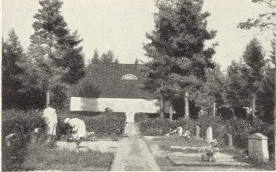
Fig. 216—23. Udsigt og interiører fra Berglunda skogs- kyrkogård (kapel, gravgård m.m.) sommer og vinter.