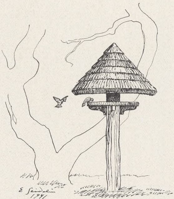
Fig. 96. Fuglefoderplads paa Mariebjerg Kirke- gaard i Gentofte. Efter Tegning af E. Seidelin.

er paa Kvibergskyrkogården i Göteborg i September 1944 jordet 99 Tyske fra Sænkningen af »Westphalen«, og (skønt ikke Deltager i den store Krig) har Landet ogsaa faaet sine egne Soldatergrave, — Grave for dem, der faldt under Udøvelse af deres Vagt for Konge, Folk og Rige.