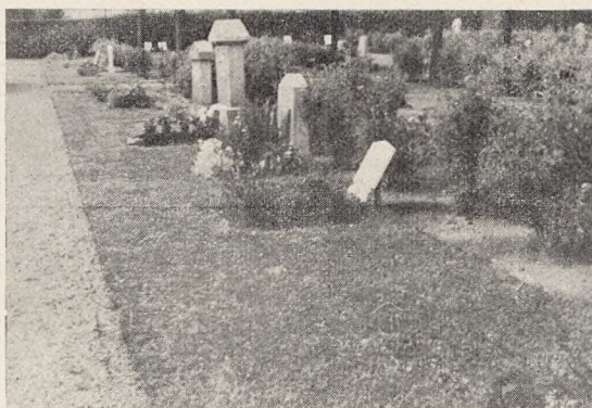
Fig. 60. Gravrække paa Pålsjö Kirkegaard, Helsing- borg.