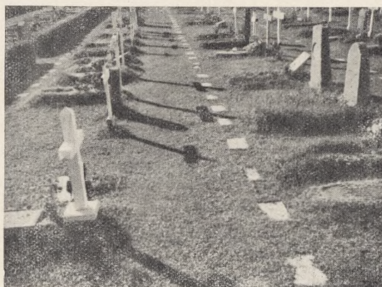
Fig. 61. Parti fra Ljusdal Kirkegaard, Helsing- land, Sverige.