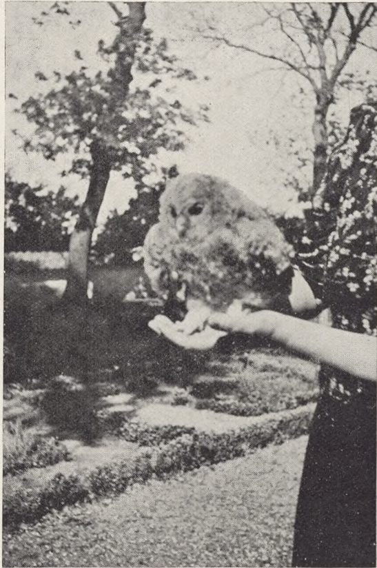
Fig. 119. Kirkegaardsugle.