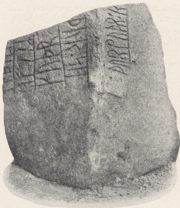
Fig. 34. Hurup-Stenen. (Se Teksten S. 25).

ind, kan disse over et halvt Aartusinde gamle Indskrifter virke paa en ejendommeligt levende Maade. Det er, som Kirken bliver befolket« . . .