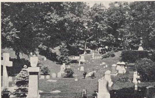
Fig. 129, 130 og 131. Partier fra Forest hill cemetery.

skabeligt Anlæg. Det passer egentligt daarligt til Linjebegravelserne, hvor den første Række Grave i en ny Afdeling kendetegnes ved en lang Jorddryg svarende til Jordforøgelsen, da det er for kostbart at køre Jorden bort — snart bliver Ryggen til en Vold, men først, naar hele Afdelingen er færdig belagt fra Ende til anden, er hele Arealet blevet hævet en Kistehøjde. Det gør et nedslaaende Indtryk at se, at kun ganske enkelte Grave er smykkede med en Blomst, medens de fleste ligger upasjede hen, indtil hele Arealet tilsidst planeres og tilsaas med det forsonende Græs. Afstandene er for store og det daglige Arbejde for de Paarørende for krævende, til at de fleste kan naa at se til deres Kæres Grave, et typisk Tegn paa Storbyens fortravlede Jag.