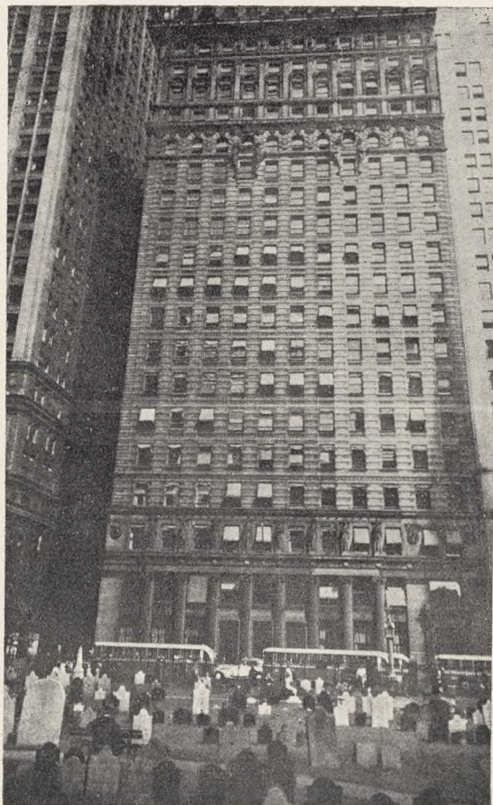
Fig. 127. Den gamle Kirkegaard ved Trinity church, New York.

Jeg kom i 1926 paa en Studierejse gennem U. S. A., og naar man færdes hastigt og kun har nogle faa Dage i New York med dens infernalske Spektakel over een (Sporvogne), under een (Undergrundsbanen) og paa Gaden, saa trænger man til et Fredens Fristed, som helt uanet aabner sig med opslaaede Portaler og Orgelbrus paa Hjørnet af Broadway og Wallstreet, hvor man