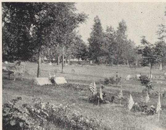
Fig. 132. Grave smykket med Union Jack paa War memorial day.

Den 31. Maj er »Memorial day« til Minde om de i Krigene faldne Soldater. De store, pompøse Mindesmærker inde i Byerne smykkes med Foraarets nationale Farver — Kornblomster, røde Valmuer og Margeritter — og de efterladte besøger Gravene paa Kirkegaarden, sjældent medbringende Blomster, der er for dyre, som oftest et Silke-Union Jack, der plantes paa Graven (se Fig. 132); underligt at se for os