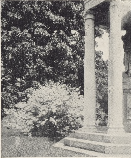
Fig. 128. Greenwood cemetery. Gravmæle og Cornus florida-Buske.