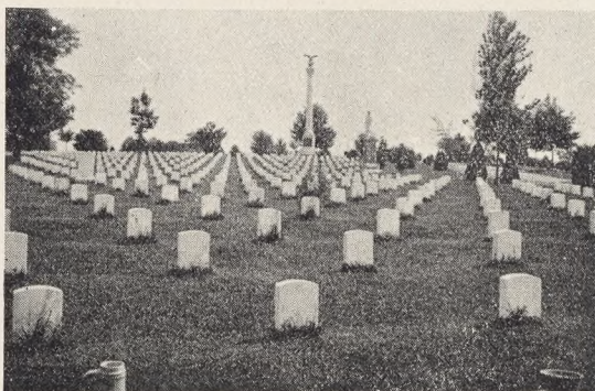
Fig. 133. Soldaterkirkegaarden i Arlington.