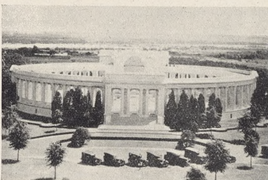
Fig. 134. Ceremoniplads ved Den ukendte Soldats Grav i Arlington.