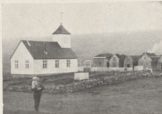
Fig. 78 tv. Kirkegaard ved Vidiemyri Kirke, en af de ældste Græs- tørvkirker; over Sjæleleddet (Laagen) midt for Kirkedøren Portal af Træ med Kors. Foto: P. Buhl 1934.