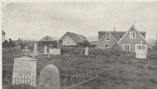
Fig. 77. Kirkegaarden paa Thingvellir. Hegnet af Sten og Græstørv; udenfor Hegnet Præ- stegaard og Kirke. Jevnf. Fig. 80. Foto: 1927.