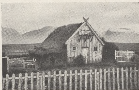
Fig. 79 th. Kirkegaard paa Einarstadir i Reykja- dal. Hvidmalet Kirke opført paa Kirkegaar- den. Hvidmalet Stakit imod Vægen, ellers Stengærder. Foto: G. Funk 1917.