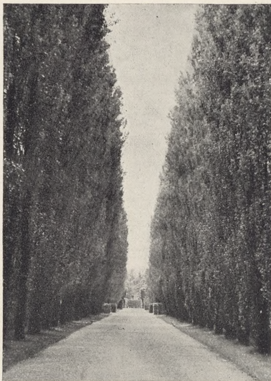
Fig. 142. Poppelalléen paa Fredens Kirkegaard.

Mange gode Medarbejdere er i Aarenes Løb taget bort ved Døden. Navne skal her ikke fremdrages; men vi mindes dem med Ærbødighed og Tak. Og stadig samler der sig en stor Kreds af Interesserede om Foreningen og dens Arbejde. Ved et Jubilæum skal man ikke blot se tilbage, men ogsaa fremad. Det er da glædeligt, at der stadig melder sig Opgaver, og stadig er Lyst og Iver til at tage disse Opgaver op. Maatte »Foreningen for Kirkegaards-kultur« da ogsaa i de kommende Aar faa Lykke til at virke i sit Programs Tjeneste til Gavn for vore Kirkegaarde.