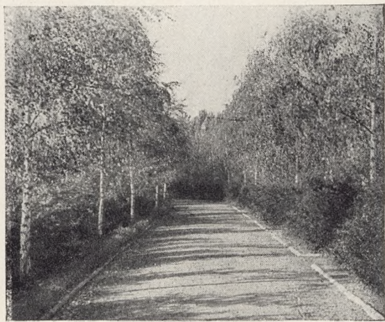
Fig. 7 tv. Allé af Prunus Hisakura, Standpunkt E.