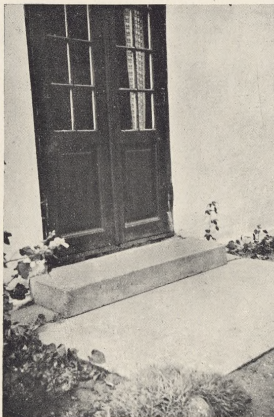
Fig. 159. Havedør paa Ørungaard ved Frederikssund med Ligsten fra Udesundby Kirkegaard. Foto: A. Garboe 1938.

Erfaringen viser, at de Paarørende den Dag, de skal vælge Gravsted til deres Af-døde, ikke synes de kan gøre det godt nok, og derfor vælger et stort og dyrt Gravsted, uden at tænke paa, om de nu ogsaa senere har Midler til at holde Graven vedlige. For at sikre sig imod, at der kommer til at ligge forsømte Grave til lige stor Ærgrelse for Ejeren af Nabo-graven som for Kirkegaarden, forlanges der ved Købet af disse Gravsteder, at Renholdelse, Vanding, Blomster og Granpyntning betales for det Tidsrum, for hvilket Graven er købt og derfor besørger af Kirkegaarden. Ved en saadan kollektiv Pasning af Gravene opnaar man ogsaa at kunne gøre det billigere, hvilket kommer alle Parter til Gode.