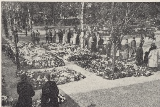
Fig. 44. Soldatergraven September 1944.