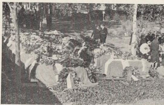
Fig. 42–43. Soldatergraven Sept. 1943.

Muren er beklædt med Vedbend, som dog endnu langt fra dækker. Foran Muren er en meterbred Rabat, der mod Græsset begrænses af Begonia semp. Weisse Perle,