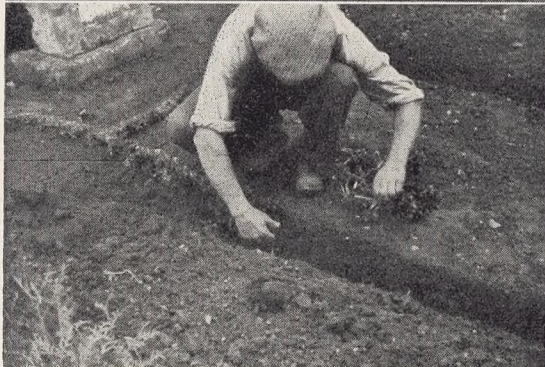
Fig. 22-24. Plantning af Bux- bomkanter.