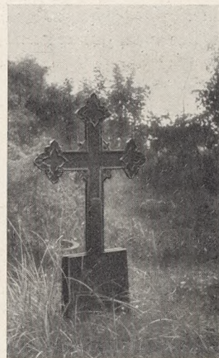
Fig. 33. Støbejernsgravmæle paa Skagens gamle Kirkegaard.

skal nedsættes i Jorden) enten kan benytte Beholdere, der er opløselige i Vand, f. Eks. Pap, støbt Papirmasse eller lignende, eller lade Asken blande direkte med Jorden. Navnlig ved den sidste Foranstaltning maa det kunne tænkes, at Aske og Jord kan indgaa en organisk Forbindelse, og at Asken vil kunne indgaa i den Stofomdannelsesproces, som til Stadighed finder Sted, — dog er det utvivlsomt, at denne Proces vanskeliggøres noget ved den i Kirkeministeriets Cirkulære af 5. Marts 1935 fastsatte Dybde, hvori Askeurnerne skal nedsættes, nemlig saa dybt, at der kommer en halv Meter Jord over den. Bakterielivet flourer jo navnlig i det egentlige Muldrag, — Jordens øverste Dele, og det er ved dettes Hjælp, at Stofomdannelsen finder Sted. Men det er langt