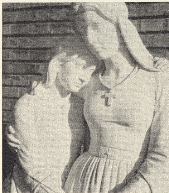
Fig. 89. Prior: Symbolsk Figur til Urnehaven i Næstved.