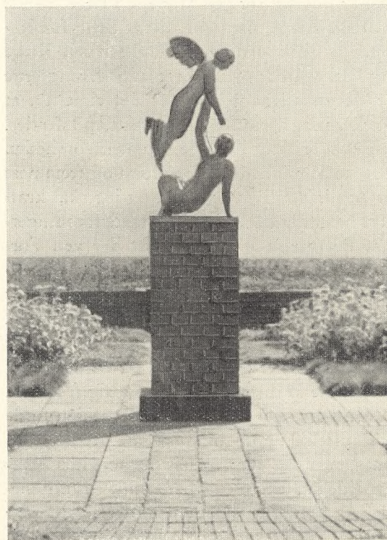
Fig. 87. Gunnar Hammerich: Symbolsk Figur i Urnehaven i Graasten.