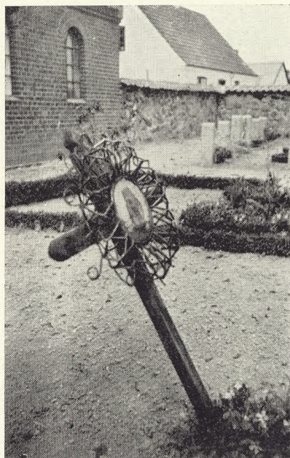
Fig. 150. Hjemmegjort Trækors med Krans af Glasperler. Agerse Kirkegaard.