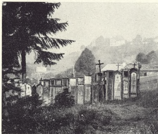
Fig. 158. Fra en bayersk Bjerglandsbys Kirkegaard.

Kvinde? ... Degnen? Præsten? eller helt andre --? Men kulturhistoriske Dokumenter er disse, nu forsvundne Gravmæler af Træ med deres Inskriptioner.