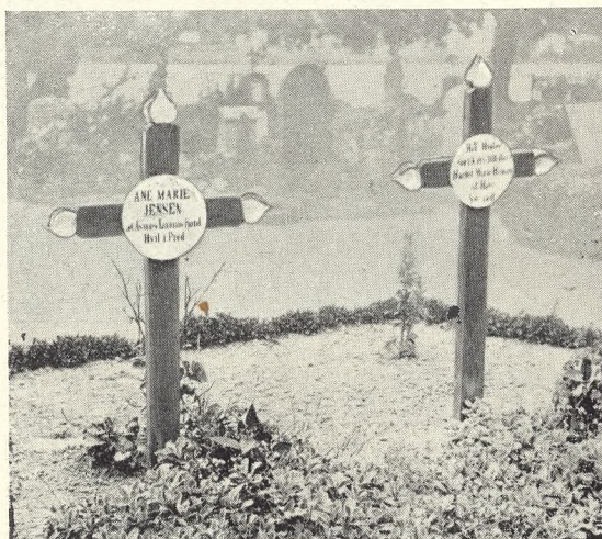
Fig. 153 tilhøjre. Del af Samlingen af Hjemstavns-Gravmæler paa Stettin Hovedkirkegaard. Foto: J. Th. 1937, (jevnt. Fig. 156).