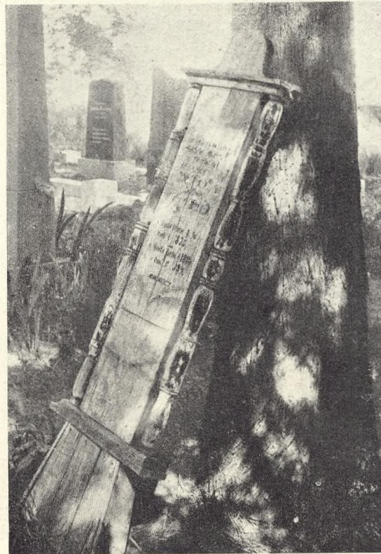
Fig. 155 tilhøjre. Dødsbrædt paa Kirke- gaarden i Sommat i Finland (efter Mailla Talvio).