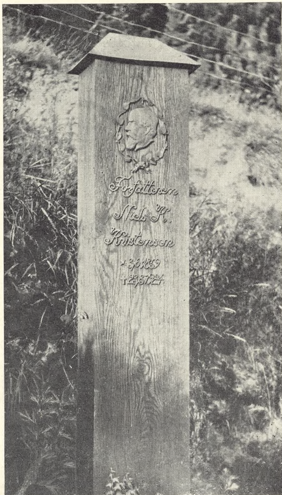
Fig. 151. Gravmæle af Træ paa Lynæs Kirkegaard.