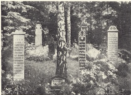
Vore Kirkegaarde Bind 14.