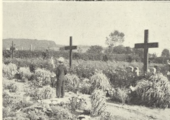
Fig. 228. Engelske Flyvergrave i Aabenraa.

i Aabenraa (se Fig. 228), i Esbjerg (Fourfelt), Furreby, Kalundborg, Lemvig, Mersløse, Odense (se Fig. 226–27), paa Rømø (se Fig. 232), i Skagen (se Fig. 231), i Tranbjerg paa Samsø og i Tønder, foruden de tidligere i »V. K.« omtalte og afbildede