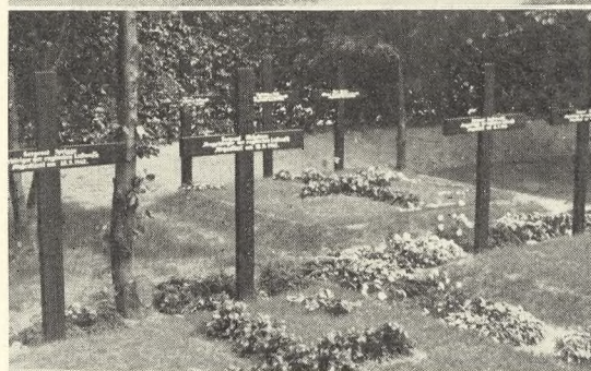
Fig. 226-27. Engelske Flyvergrave i Odense. 1942.