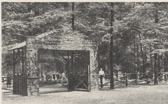
Fig. 271. Soldaterkirkegaard ved Grebbeberg i Holland.

Naar man definerer en Kirkegaard som en ved gejstlig Medvirken indviet Begravelsesplads for forskellige, hinanden uvedkommende Mennesker, og altsaa ikke regner de enkelte private Begravelsespladser ved forskellige Slotte og Herregaarde (f. Eks. ved Ledreborg ved Lejre) for Kirkegaarde i almindelig Forstand, tør man vist trygt be-