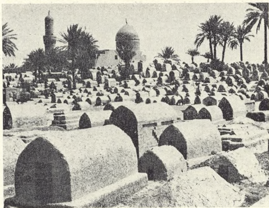
Fig. 176 tilvenstre. Maruf af Karkhs Moské uden for Bag- dad med Grave foran.