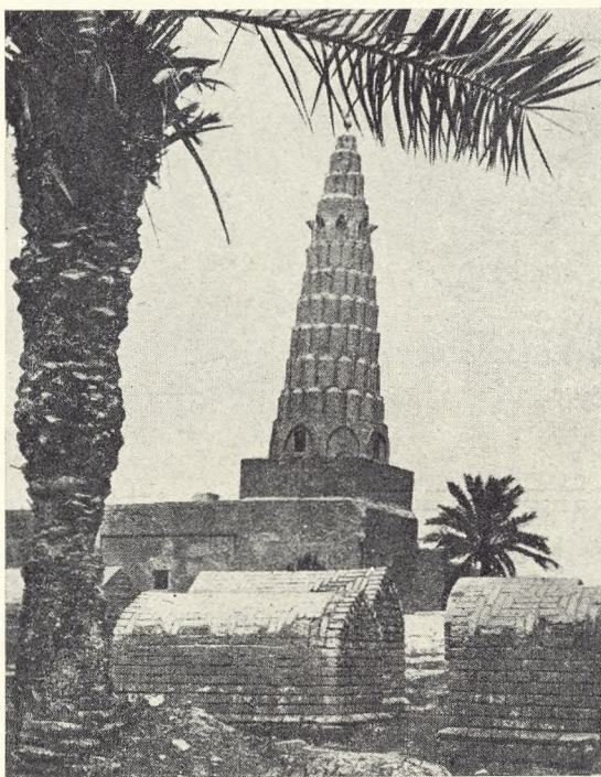
Fig. 174. Zublidas Grav ved Bagdad.