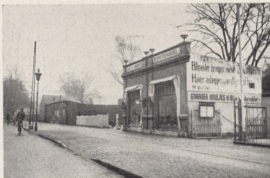
Fig. 284. Den uheldige Facade imod Gaden (Holmens Kirkegaard).

At lovgive om en enkelt (eller et Par) Kirkegaarde er noget usædvanligt, og i det hele taget skiller disse 2 Kirkegaarde sig i mangt og meget ud fra de øvrige københavnske. De er ikke (som de fleste af Byens andre) kommunale; de er selvejende i den Forstand, at de ejes af de paagældende Kirker. Og desuden er der det mærkelige ved dem, at de for de paagældende Kirker betyder en væsentlig Indtægt, mens Kommunen selv (efter den vedtagne Ordning) maa betale et ikke uvæsentligt Underskud for sine egne Kirkegaarde. Navnlig det sidste er det værd at lægge Mærke til; thi for mange Kirker betyder Kirkegaardene en