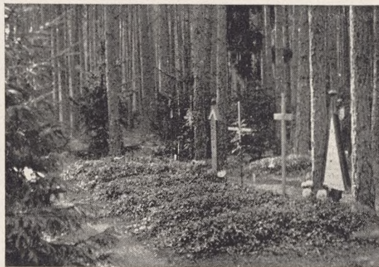
Fig. 285. Mønstergrave, dækket af Vinca, til Brug ved Demonstration af forskellige Gravmæletyper; 14de Kvarter (Jevnf. Plannen næste Side). Billede fra Aar 1927.

»Skogskyrkogården« minner oss om rader av svartklädda människor, som stilla vandra på vägarna för att taga farväl av