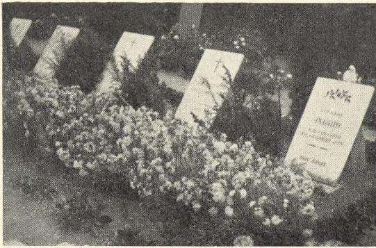
Fig. 25. Familiegravsted med Bregner og hvide Nelliker. Asnæs. Foto: J. Th. 1926.