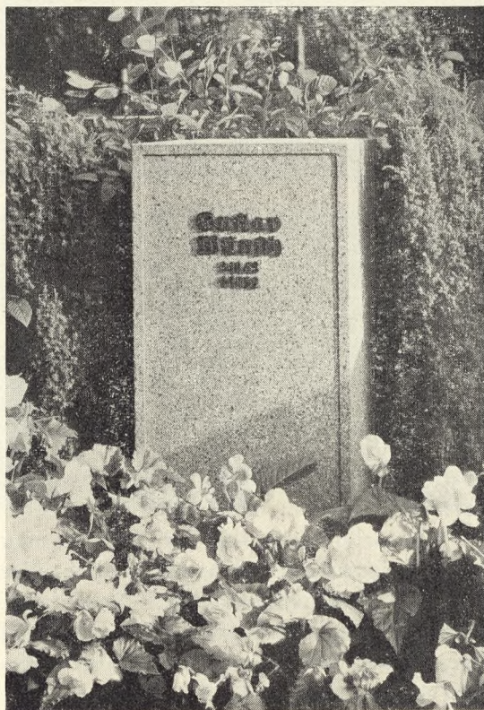
Fig. 29. Begonia Dr. Kerl paa Kirkegaard i Reichen- berg, Sudeterland.