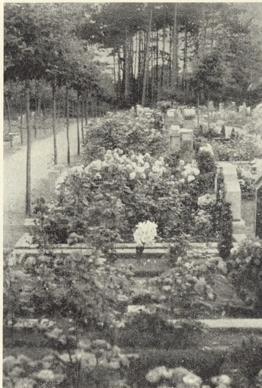
Fig. 28. Polyantha-Roserne blomstrer paa Rønne Kirkegaard. Foto: J. Th. 1936.