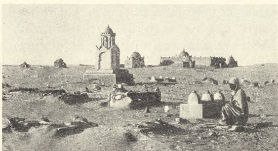
Tilvenstre Fig. 223. Kongegrave foran Tuggurt.