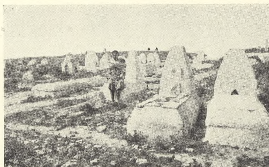
Fig. 222. Arabisk Kirkegaard.

Fællesraad for Havekunst har haft en Konference med Kirkeministeren og Departementchefen om Sagen, og det kan vel have sin Rimelighed, at der før eller senere findes en tilfredsstillende Løsning.