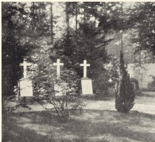
Fig. 248. Claras Kirkegaard paa Køge Aas.