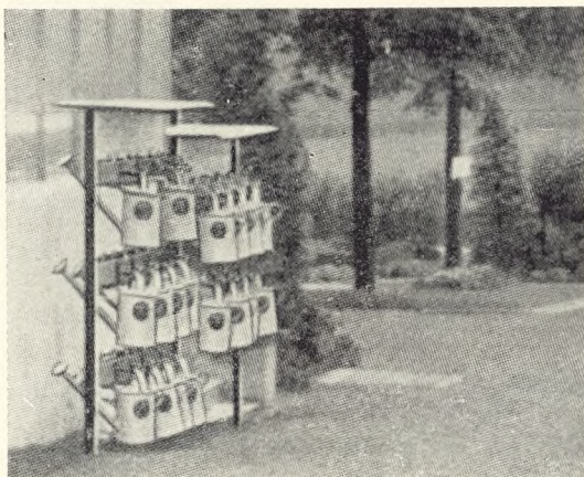
Fig. 61. Kandeanordning.