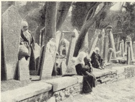
Fig. 63. Kvinder om Fredagen paa Kirkegaarden i Skutari.

oven, som et Bur, med Halvmaane over Spidsen. Ellers er Enkeltgravene ganske smalle og smaa efter Legemet, med en Sarkophag over eller blot et Laag, der skraaner ned til begge Sider; eller i Form af en firkantet Stenkarm om et Stykke Græs, eller blot to Steler, en større, smykket, for Hovedet (vendt mod Mekka), en mindre (der kan mangle) ved Fodenden. Paa Hovedstelen kan være udmejslet en Turban eller Fez — ofte rødmalet — paa en Effendis (Mands) Grav,*) en Blomst, en malet Cypres paa en Kvindes, en Rosenknop paa en ung Piges. Indskriften — om der er nogen — er i Højrelief, gerne forgyldt, blaa eller rødmalet med de tyrkisk-arabiske Snørkeltegn; kun øverst paa Højen finde vi Grave med de nyindførte latinske Bogstaver (efter 1929). Mange Sten staar paa Skraa, halvt ned-