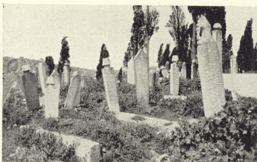
Fig. 62. Tyrkisk Kirkegaard i Brussa.

Udenom gaar Gader og Trapper gennem den egentlige Kirkegaard paa Højen under de spredtstaaende Cypresser — mange er faldne af Alder. Tæt, tæt, tæt ligger Gravene i Græsset, uhegnede; nogle er skredet ned ad Skraaningen eller styrtet ud over Skrænten og ligger med Gitret nederst, Stenene, Ben og Jord over. Gitre har nemlig kun Familiegrave, og det er da saadan, at Stærne gerne er svejsede sammen til at mødes for-