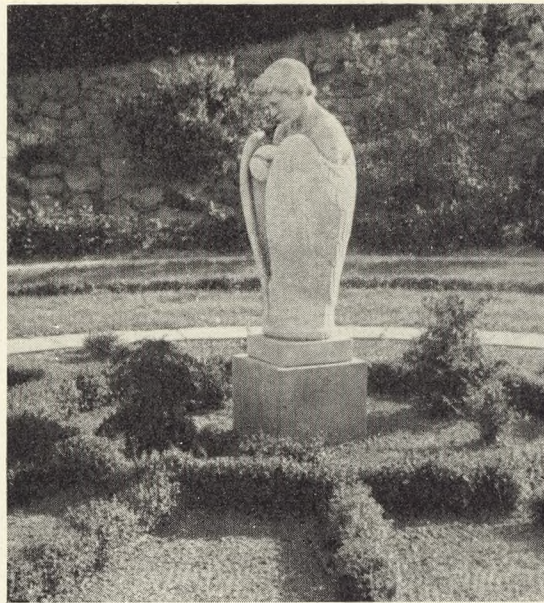
Fig. 225. Elos Skulptur i Urnehaven i Nykøbing S.

Under Anlæggelse af Urnehaven i Nykøbing Sjælland kom jeg paa den Tanke, at der her kunde være en velegnet Plads til en symbolsk Skulptur, og jeg henvendte mig da til Billedhugger Elo , fra hvis Side tidligere var præsteret interessante Arbejder i Tilknytning til Ligbrænding (f. Eks. Askeurner). Billedhuggeren udførte saa i en fransk Kalksten den symbolske Figur, som her er afbildet (se Fig. 225), — en Engel med sammenfoldede Vinger, og smukt afrundet, som den er, passede den ganske fortrinligt til den Plads i Centrum af en cirkulær Urnehave, som var tiltænkt den. Dens Ro og hvilende Holdning symboliserer og fremmer Følelsen af Fred, der paa en ganske ypperlig Maade støtter Anlægget; yderligere alluderer Formen til Urnens afrundede og sluttede Form, og i Vingernes Stilling faar Engelen det stærkeste Udtryk for den beskyttende. At desuden enhver saa efter sin Overbevisning kan lægge et religiøst Motiv deri, siger sig selv, foru-