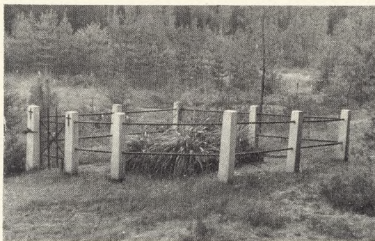
Fig. 163. Finsk Frihedsgrav fra 1918.

I Brynene af de uendelige Skove, ved Bredderne af de utallige Søer, i Ødemarke eller i Ly bag Stengærdernes Kirkegaardshegn ligger Ofrene fra Finlands Frihedskamp 1918. — Feltmarskallen fra denne Kamp udtaler, at Krigen af 1939 er sidste Akt af denne Kamp. Nordiske Brødrefolk føler med Finland og nærer det Haab, at de Grave, som den nye Kamp maa bringe det tapre Folk, maa blive faa, og at Ofrene ikke maa blive gjort forgæves.