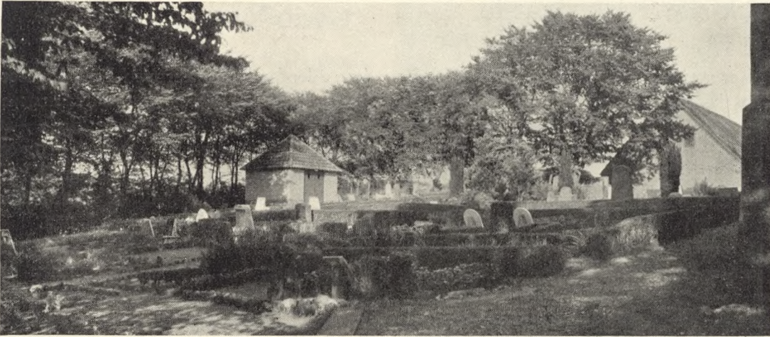
Fig. 15. Kirkegaard med Lighus i Aarslev.