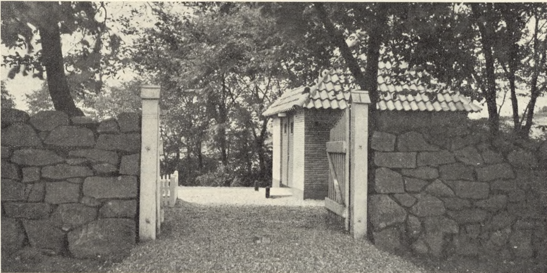
Fig. 16. Indgang til Aarslev Kirkegaard.

Men saa kommer Stedbarnet: Lighuset! Det vil saa let komme til at ligne en »Vaabenhus-Lillebror«, der ikke kan finde hjem, men staar forladt et tilfældigt Sted, eller værre endnu: tigger om at blive taget med op til Bror, der mageligt læner sig op mod Kirken.