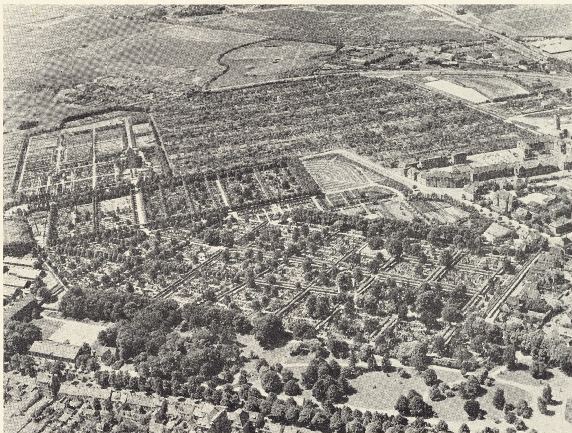
Fig. 137. Odense Assistenskirkegaard i Luftfotografi. Kapellet ses midtpaa tilvenstre.

Kapellet er opført paa Kirkegaardens vestre Afdeling i nær Tilknytning til Parkeringsplads og offentlig Vej. Pladsen indrettedes ved en Kirkegaardsudvidelse i 1931 med en eventuel Kapelbebyggelse for Øje, og naar med Tiden en Del af de tilstødende Kolonihavearealer er inddraget til Kirkegaard, vil