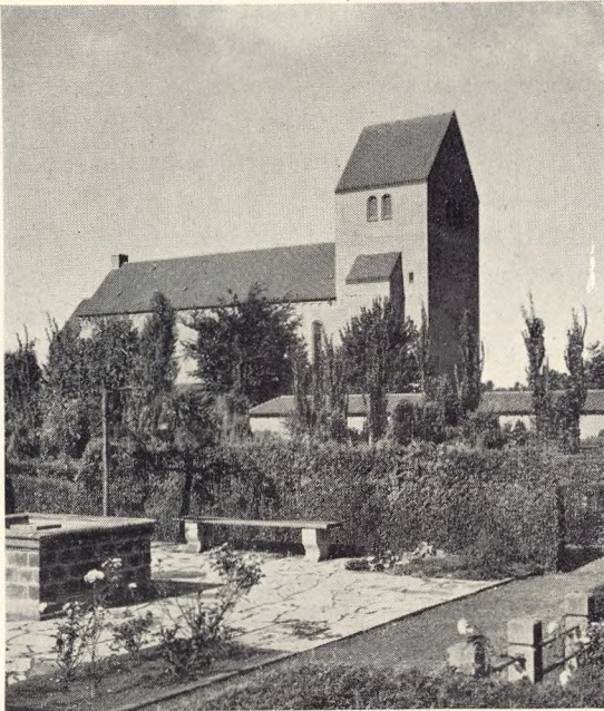
Fig. 138. Kapellet set fra en Brøndplads paa Kirkegården.