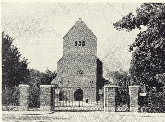
Fig. 145. Hovedindgang og Klokketaarn.