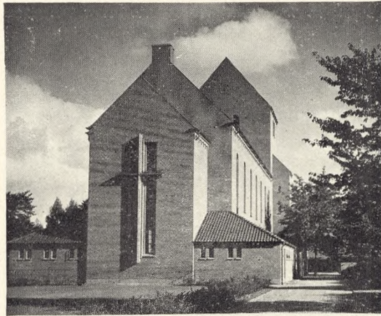
Fig. 141. Kapellets Vestgavl.