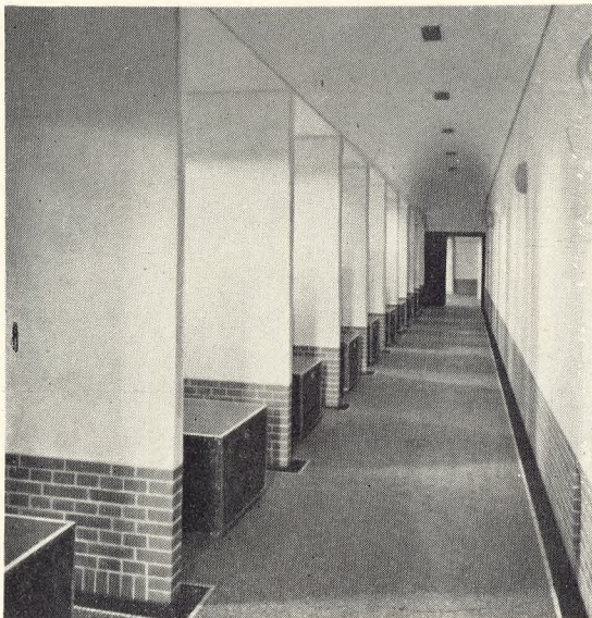
Fig. 144. Søndre Ligrum.