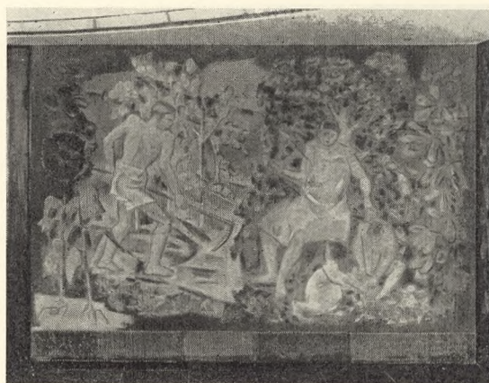
Fig. 100. Georg Jacobsen: Motiv fra Udsmykning af Søndermark Kre- matorium (Fresco).

livet fra Fødsel til Død. Motiverne, der i mangt og meget minder om dem, der nu smykker det nye Krematorium i Oslo og er udført af Alf Rolfsen , er ret realistiske, og de duce Farvevirkninger er behagelige, men det er desværre umuligt at faa en Reproduktion til at give mere end en Anelse af Billedernes Virkning (se om Søndermark Kapel og Krematorium, iøvrigt »Vore Kirkegaarde« VI S. 69-80).