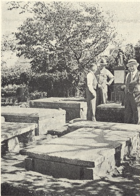
Fig. 102. De gamle, smukke Gravliggere af Sand- sten paa Christiansø.

är artisen Virkkalas önskan att förverkliga denna princip på Gamla begravningsplatsen, så långt det sig göre låter. — Förutom kartan skall man även upprätta ett register över alla döda, även tidigare, så långt man har tillgängliga uppgifter, d. v. s. sådana finnas från 1863. Också alla inskriptioner komma att bokföras och gamla gravvårdar och kors lämnas kvar även efter det själva graven upphört. Åbo stad har anslagit en summa för vården av gamla gravstenar och kors. Församlingarna sköta om gravvårdar paa gamla prästgravor.